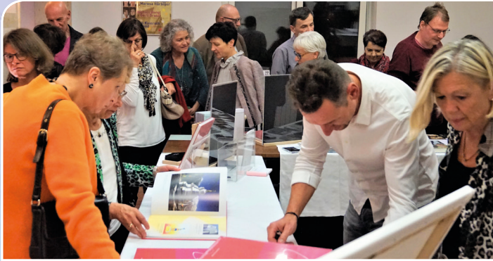
GROSSES INTERESSE AM BUCH „SIGNATUR LIEBE“.

Für den Signatur-Teppich wurden tausende Signaturen digitalisiert und nahtlos zu einem kalligrafischen Endlos-Band miteinander verbunden. Alle Originalschriftzüge der beteiligten Menschen werden in einer Skulptur aufbewahrt und immer vor dem gewobenen „Signaturen-Teppich“ platziert. Die Gefühle und Gedanken aller Mitwirkenden werden unmittelbar in dieser Installation sichtbar, spürbar und erlebbar: Liebe steht im gemeinsamen Fokus, Liebe ist an diesem Ort wirksam.