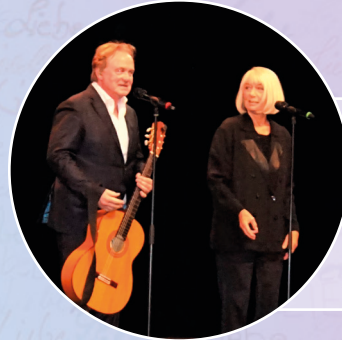
BEWEGENDER MOMENT: SÄNGER KLAUS HOFFMANN UND SÄNGERIN ERIKA PLUHAR GEMEINSAM AUF DER BÜHNE.